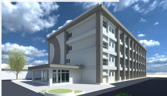
※これは現在の完成イメージです

皆さんを迎えるために、新しい校舎を建設中です。今まではない発想の教室も計画されています。また、農業の実習地には、新施設を導入予定です。これらをどう活かすかは、皆さん次第です！